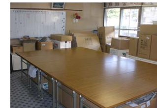
《 作業室 》

ここで製袋作業を行っています。初心者の方でも取り組みやすく、無理なく続けられることができます。