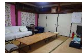
《 談話室 》

昼食はここで食べます。また、作業の合間の休憩としても使えます。居場所として利用する方はごろごろと横になったり、お茶を飲んだり、ゆったりくつろいで過ごせます。